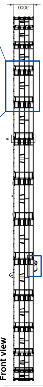
12" suction line for emptying